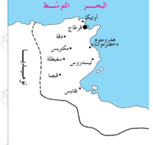
خريطة أفريقيا الرومانية